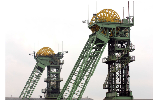
Initiativkreis für Denkmalpflege, Stadterhaltung und Stadtbildpflege in Ahlen e. V.